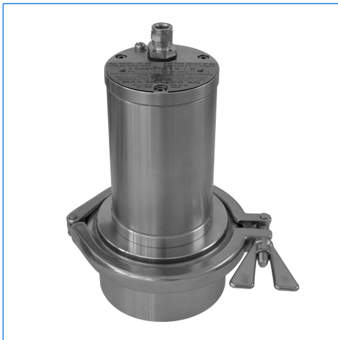
Projecteur LED EdelLUX, type EdelEx LED, Ex d IIC T6 Gb, Ex t IIIC T80°C Db IP67, Ex II G + D, monté sur hublot à verre moulé pour raccords Triclamp®, DN 50, PN 16