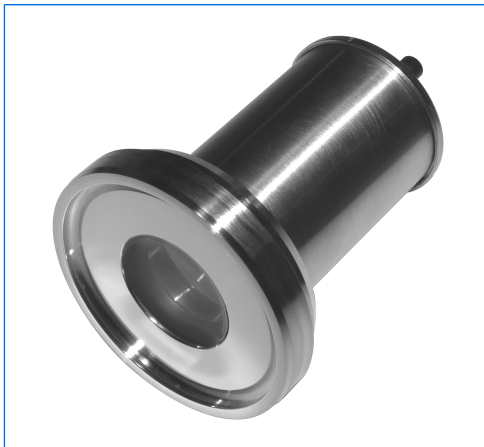
Projecteur LED miniLUX, type BKVLR LED, monté sur hublot à verre moulé stérile