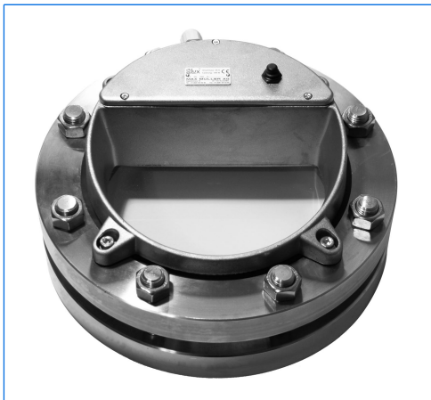
Projecteur LED metaLUX, type HL 200 LED, sur hublot selon DIN 2810, DN 200, PN 10

MAX MÜLLER S.A. suit l'évolution de la technologie LED de près depuis des années. Il en résulte un large spectre de projecteurs pour diverses applications dans les industries pharmaceutiques, chimiques, alimentaires ou dans l'environnement. Les projecteurs LED offrent les avantages principaux suivants: