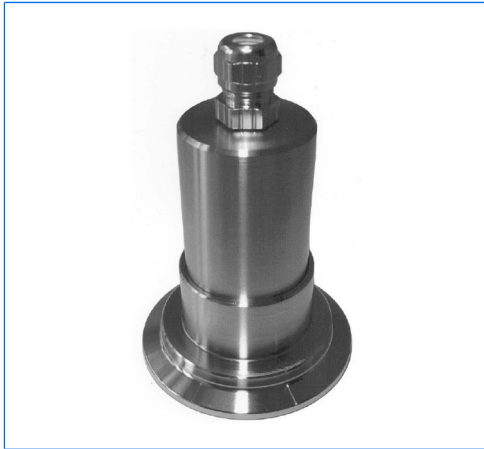
Projecteur Micro-LED, type MVLR 2 LED, monté sur hublot à verre moulé pour raccords Triclamp®, DN 50, PN 16