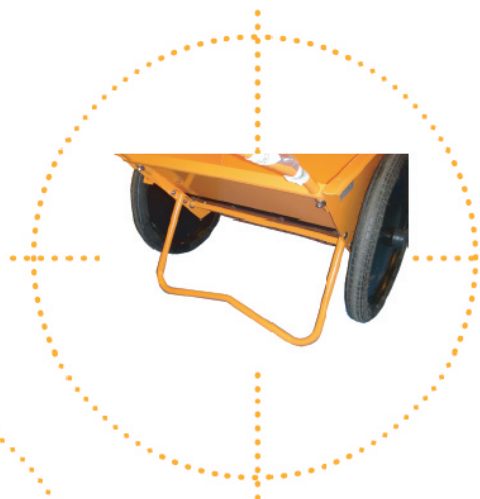
Béquille de repos