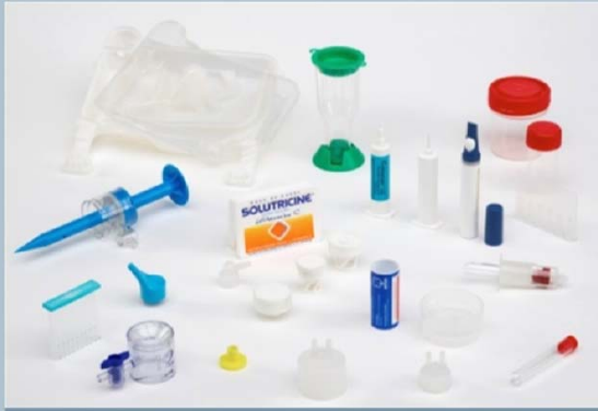
+ Dispositifs médicaux