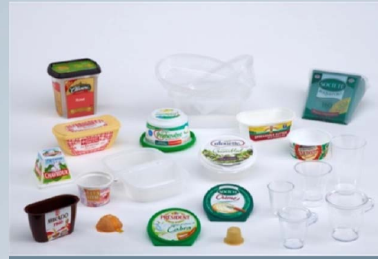
+ Emballages alimentaires