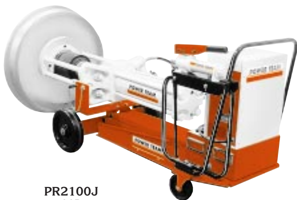
PR2100J AAR geprüfte Vorrichtung