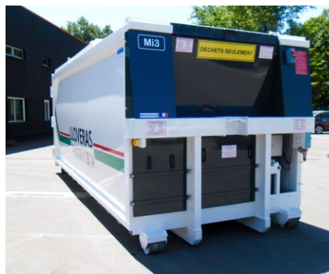
• Tôle de mise à quai, capot compensé, Commande à distance