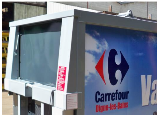
• Capot de fermeture ( Closing cover )