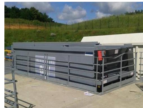
• Version à quai ( Docked version )