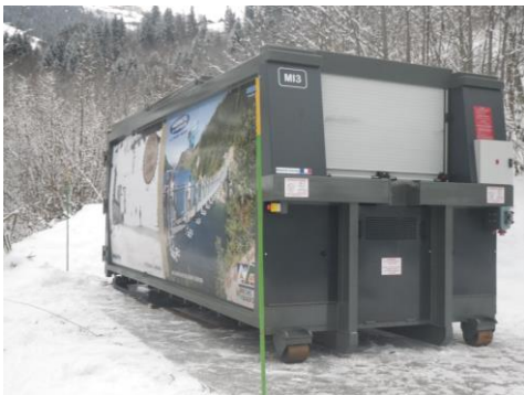
• Options : Déko, Rideau de fermeture, Contôle d'accès avec badge