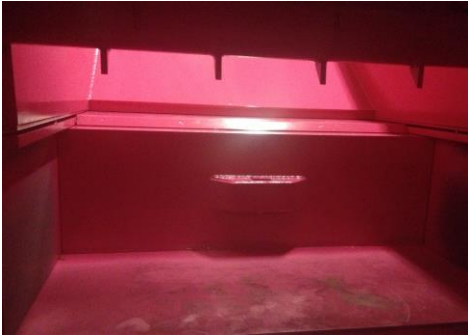
• Vue intérieure: grande pénétration du bouclier ( Inside View Rammer plate )

The PAKTOR Mi3 is a new concept in patented monobloc compactors