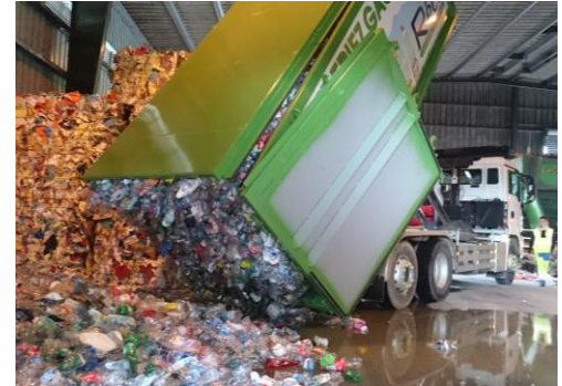
• Toit ouvrant ( Opening roof )