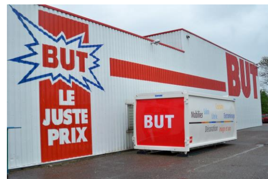
• Option DEKO-Compacteur ( Optional DEKO Compactor )