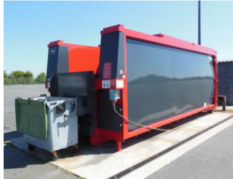
• Lève conteneurs ( Bin Lifter )