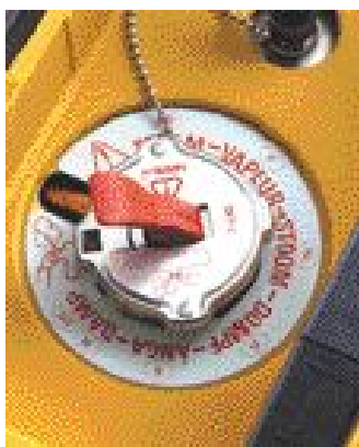
Bouchon de sécurité