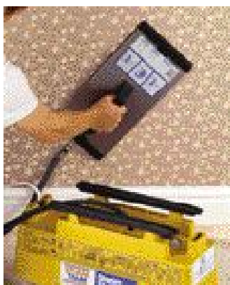
Cuve 7 litres