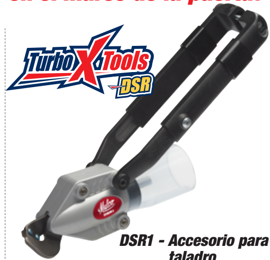
DSR1 - Accesorio para taladro