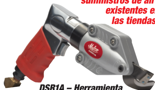
DSR1A - Herramienta neumática

¡Puede usarla con los suministros de aire existentes en las tiendas!