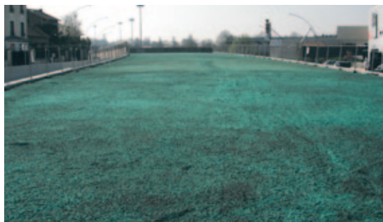
Aspect i.D. SURE à l'installation