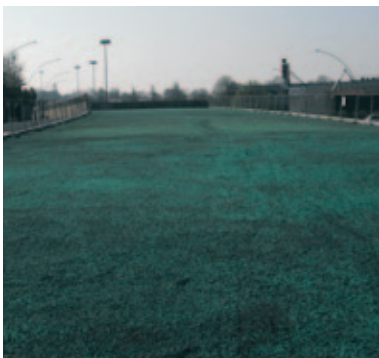
i.D. SURE à l'installation