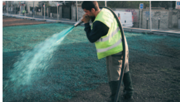
Mise en oeuvre du procédé i.D. SURE

L'utilisation de ce procédé se justifie en fonction des contraintes techniques à partir de 50 m 2 . i.D. Sure permet de végétaliser jusqu'à 3000 m 2 par jour .