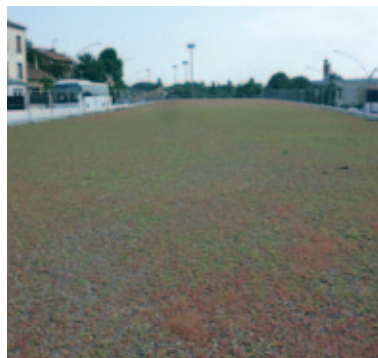
i.D. SURE après 8 mois