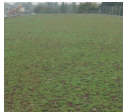
i.D. SURE après 1 an