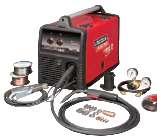
➔ MIG: SOUDAGE DÉVIDOIRS