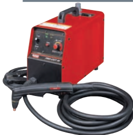
➔ DECOUPE PLASMA