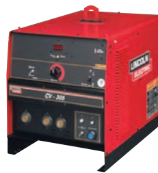
➔ MIG: SOUDAGE INDUSTRIEL