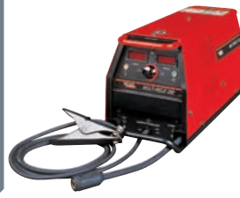
➔ SOUDAGE MULTI-OPERATEUR