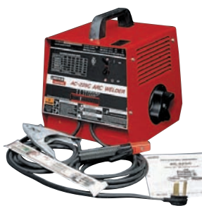
➔ SOUDAGE A ARC