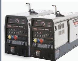
➔ SOUDAGE VANTAGE 400 /500