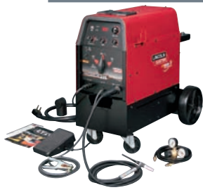
➔ TIG SOUDAGE