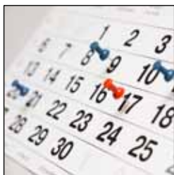
Calendrier des opérations d'entretien