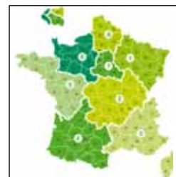
Des spécialistes près de chez vous