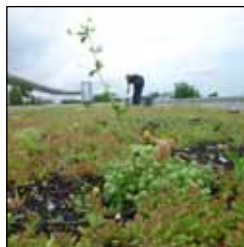
Suivi des toitures végétalisées