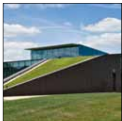
Fiche d'identité du site