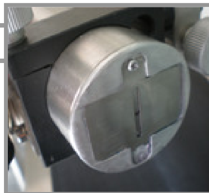
Obturbateur manuel pour protection de la tête d'impression

D'autres options sont disponibles : nous consulter