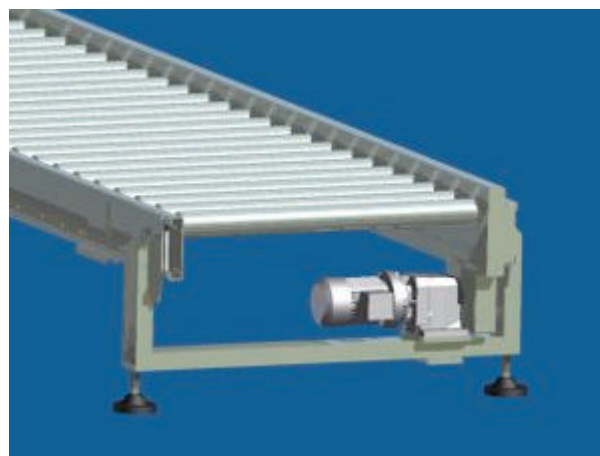
Motorizzazione con riduttore coassiale