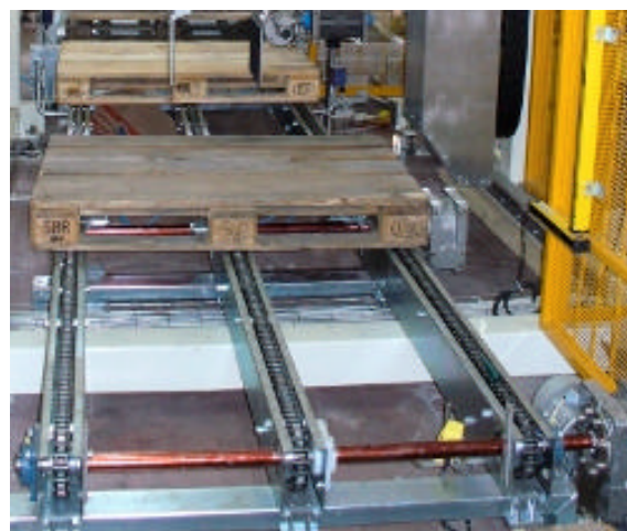
Trasportatore a catena

Questa tipologia di trasportatore trova impiego ogniqualvolta il bancale si debba muovere in una direzione in cui la superficie di appoggio non garantisca delle dimensioni minime per poter rotolare su rulli. Un esempio sono i bancali Europallet che quando traslano con la dimensione maggiore fronte marcia offrono una dimensione di appoggio (dimensione delle tre tavole longitudinali) di circa 120mm. Questa dimensione non consente il sicuro rotolamento del bancale sul rullo. In queste condizioni si usa il trasportatore a catena che offre un appoggio continuo su tre linee.