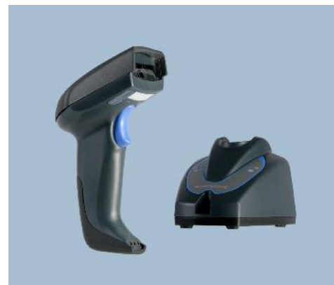
Mobile Reader et stand QuickScan