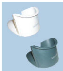
Support de table/mural Gryphon™