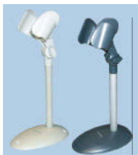
Support mains libres Gryphon™