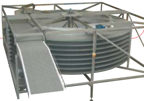
convoyeur "spirales" 8 étages