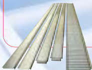
convoyeurs à rouleaux gravitaires