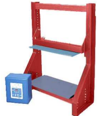
DETECTEUR DE METAUX