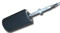
CONTRLEUR DE ROTATION