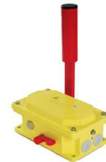
DEPORT DE BANDE