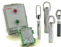
SONDE DE NIVEAU TILT SWITCH