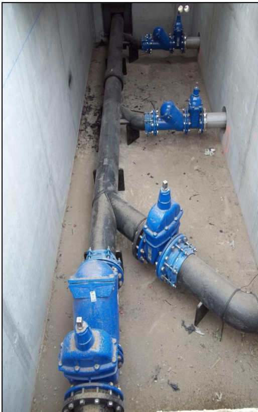
Collecteur cave sèche

Rue de la China 65 4141 Louveigné Tél. +32 (0)4 278 02 28