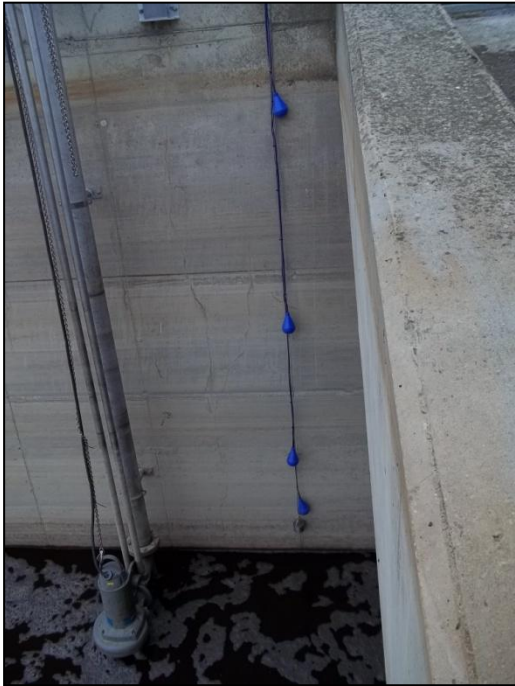
Pompe de relevage P7