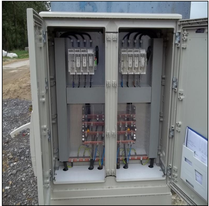
Coffret de distribution de puissance