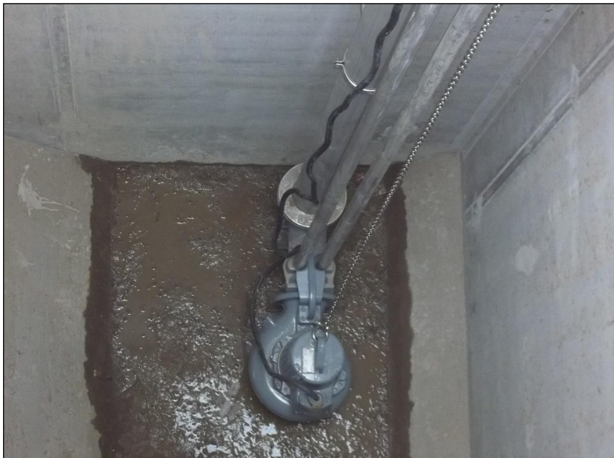
Pompe de relevage R5