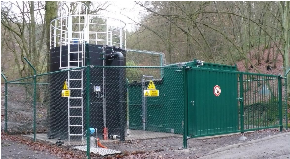
Vue générale de la station de neutralisation

La capacité de la station est de 4 m 3 /h ou 96 m 3 /j. Elle reçoit des eaux avec un pH compris entre 10 et 12 et les ramène dans une fourchette de 7 à 9.