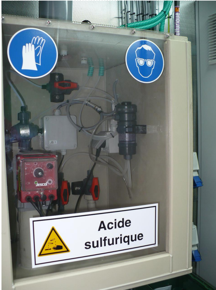
Détail de l'armoire de dosage d' H_2SO_4 37.5%