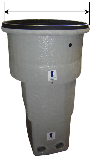
ISO PACT Version flexibles 2 DN 15