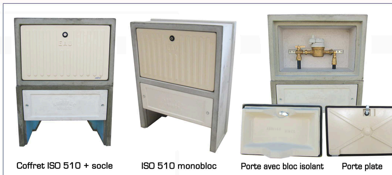
Coffret ISO 510 + socle