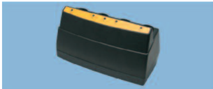
Chargeur de batteries multiples, MC-8000