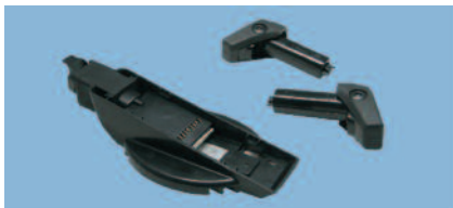
Chargeur de batterie supplémentaire, SBS-8000 Batterie extractible, RBP-8000