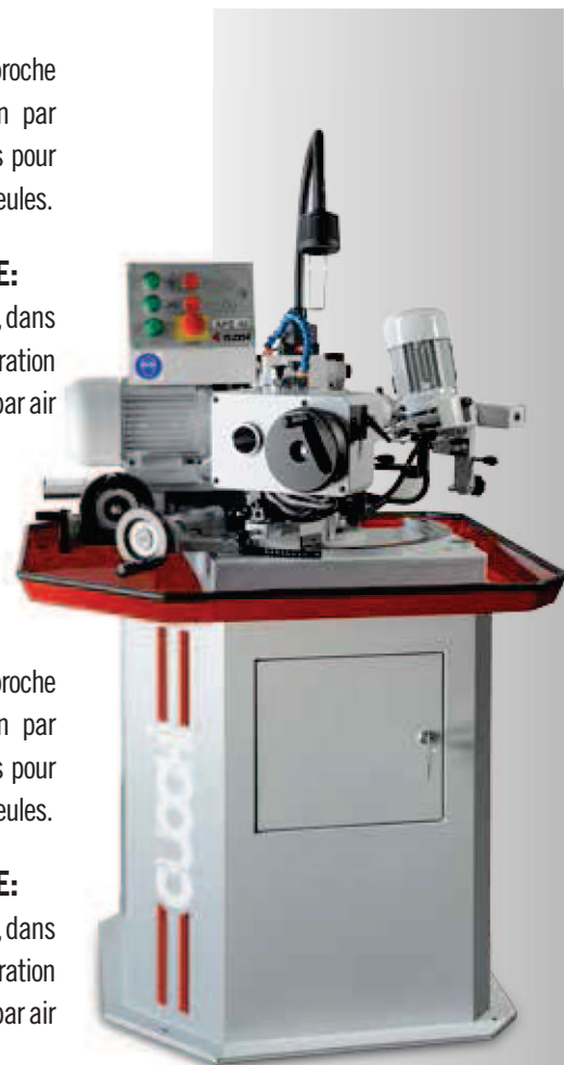
APE 40 AUTOMATIQUE

meules diamantées, meules au CBN et, dans l'alternative à l'installation de réfrigération par eau, l'installation de réfrigération par air refroidi et aspiration pneumatique.