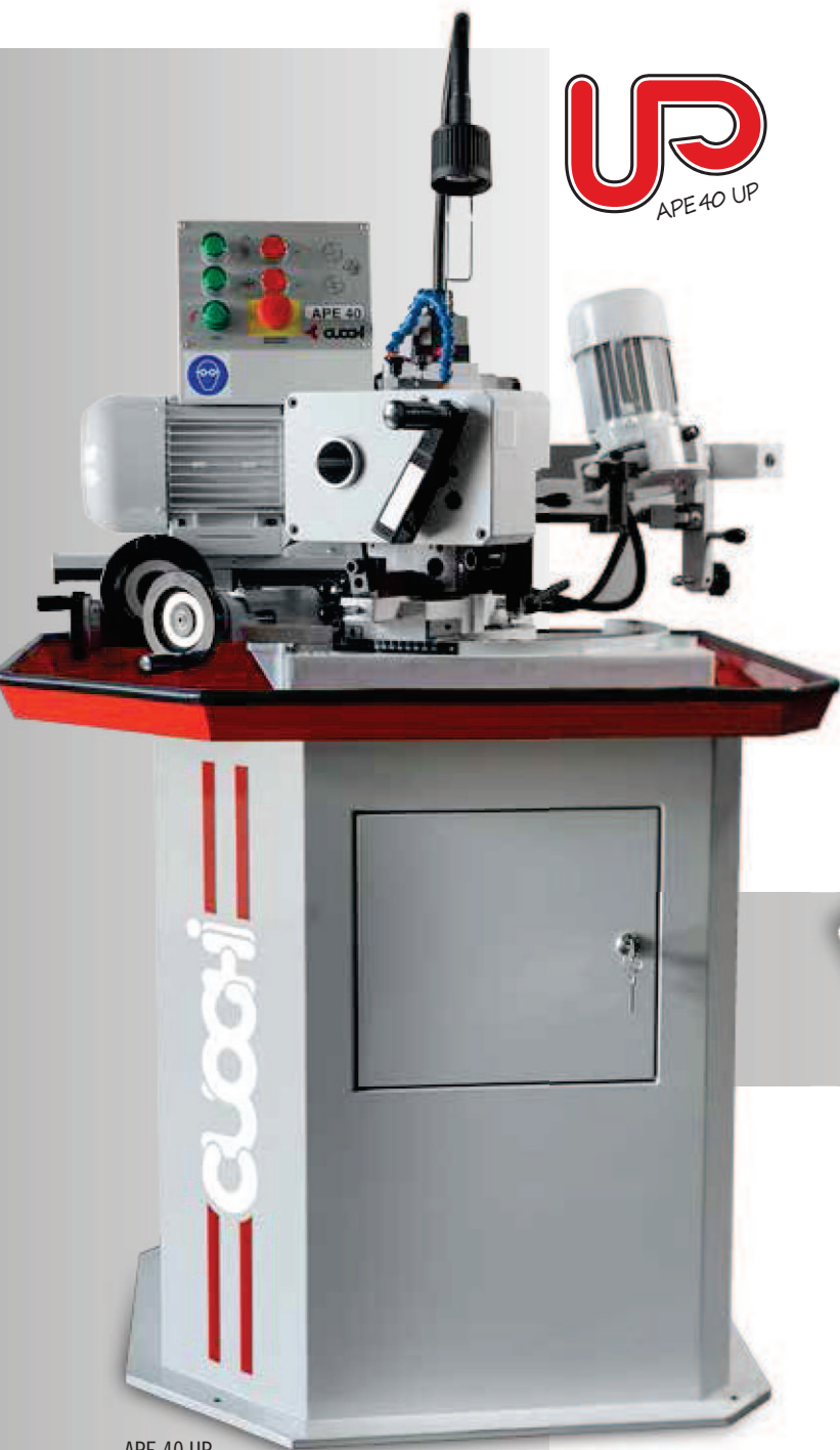
APE 40 UP