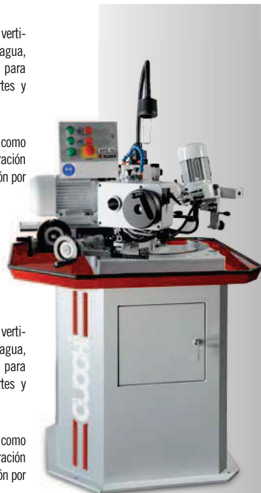
APE 40 AUTOMÁTICA

muelas diamantadas, muelas CBN y, como alternativa a la instalación de refrigeración por agua, la instalación de refrigeración por aire enfriado y aspiración neumática.