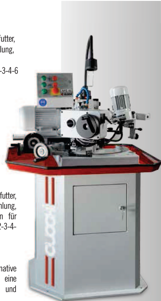
APE 40 AUTOMATIC

Diamant-Schleifscheiben, CBN-Schleifscheiben und als Alternative zur Wasserkühlung ist als Option eine Kühlanlage mit gekühlter Luft und pneumatischer Absaugung