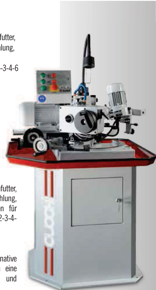
APE 40 AUTOMATIC

Diamant-Schleifscheiben, CBN-Schleifscheiben und als Alternative zur WasserKühlung ist als Option eine Kühlanlage mit gekühlter Luft und pneumatischer Absaugung