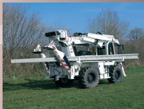
80TA30 sur CHALLENGER 7

Porteur Poids lourd 19t mini Sans accessoires de forage