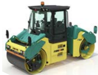
COMPACTEURS TANDEMS ARTICULÉS