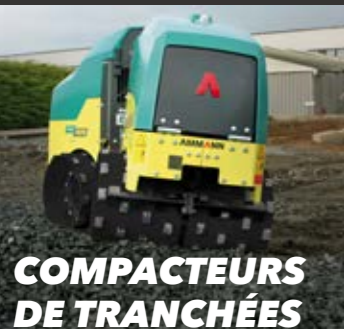
COMPACTEURS DE TRANCHÉES