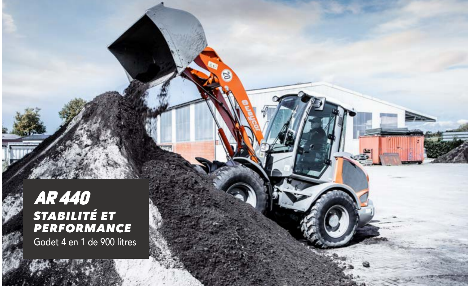
AR 440 STABILITÉ ET PERFORMANCE Godet 4 en 1 de 900 litres