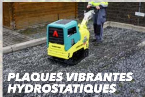
PLAQUES VIBRANTES HYDROSTATIQUES