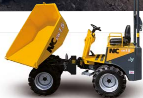
SW - 1,5t / 3t 5t / 6t Benne pivotante à 180°