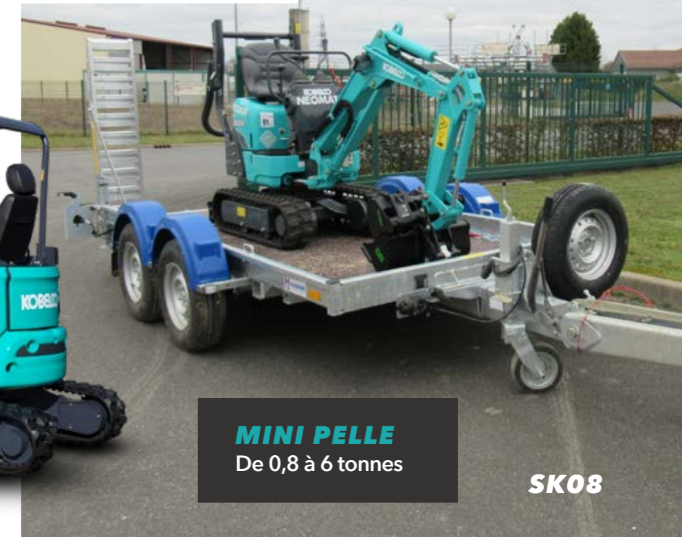
MINI PELLE De 0,8 à 6 tonnes