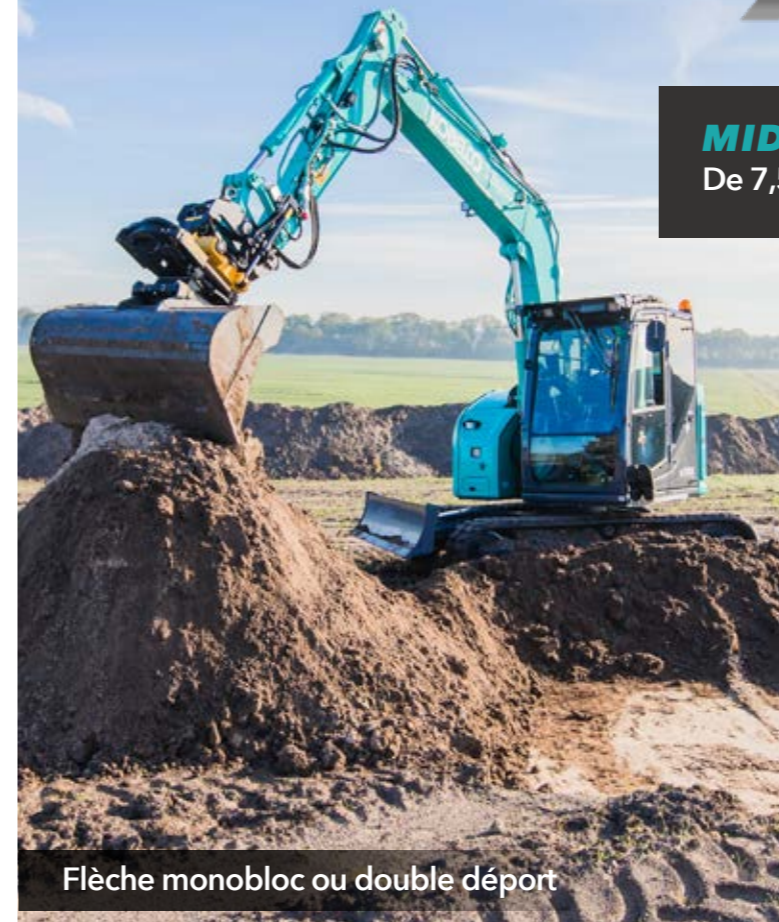
Flèche monobloc ou double déport