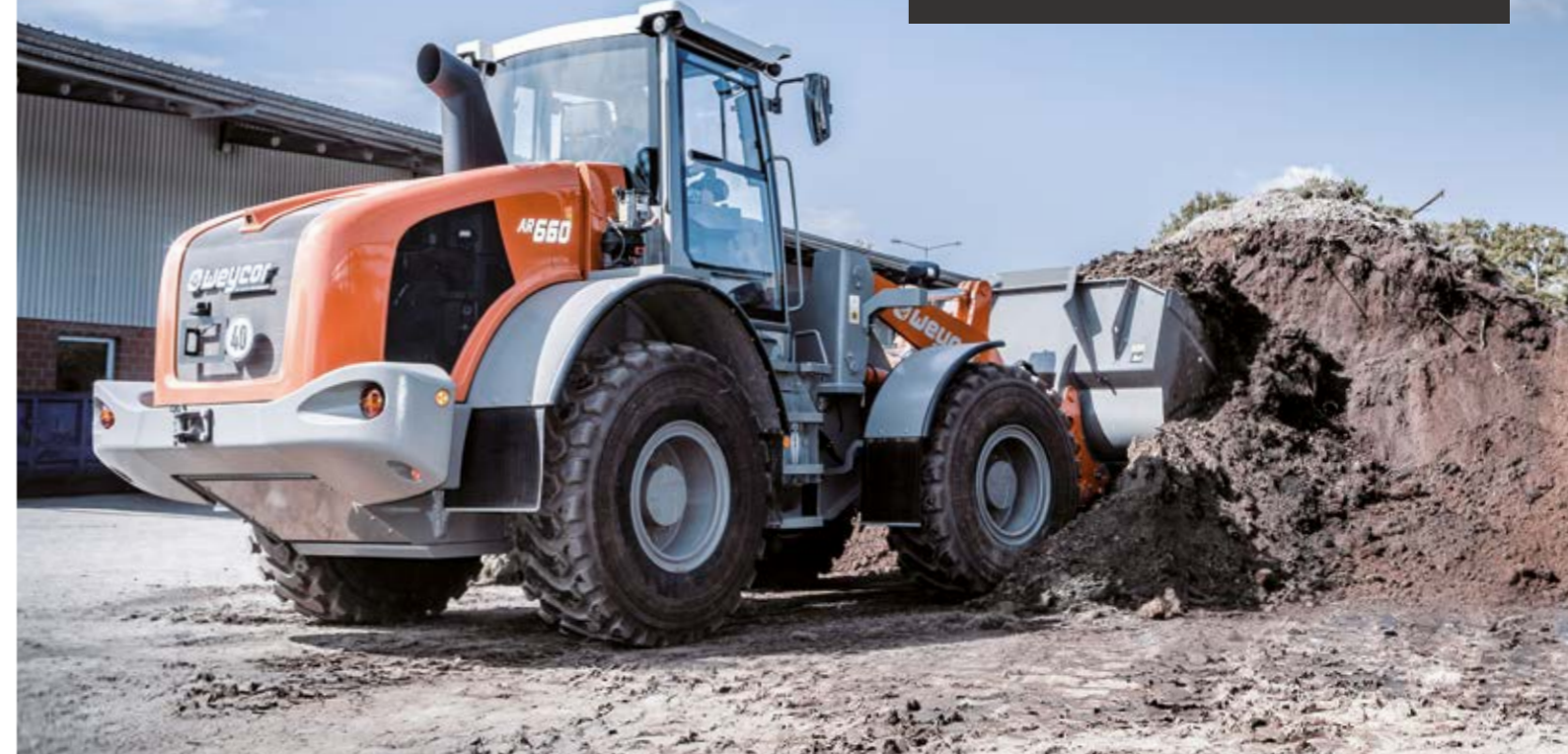
AR 660 218 CH - 2 500 L - 14 T CE QUI SE FAIT DE MIEUX DANS SA CATÉGORIE