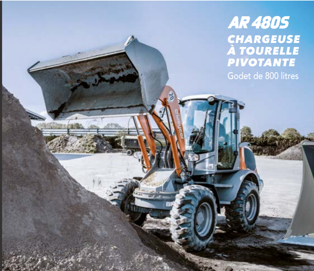
AR 480S CHARGEUSE À TOURELLE PIVOTANTE Godet de 800 litres