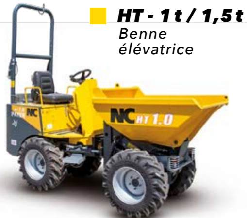
HT - 1t / 1,5t Benne élevatrice

DUMPER GAMME COMPLÈTE DE 1 À 6 TONNES 6 modèles