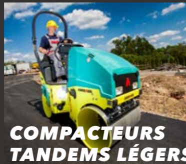
COMPACTEURS TANDEMS LÉGERS