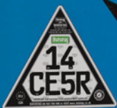
Uniek ID-Kenteken Voor Machines