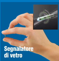
Segnalatore di vetro