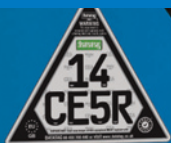
Targa di identificazione univoca dell'attrezzatura