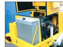
Un échangeur de chaleur très efficace