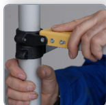
Montage des lisses