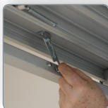
Verrou du plancher