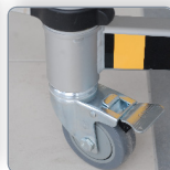
Roues Ø 100 mm Système de blocage