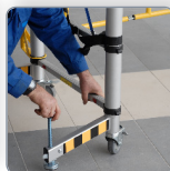
Mise en place des stabilisateurs