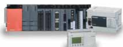
Automates programmables compacts et modulaires Mitsubishi Electric