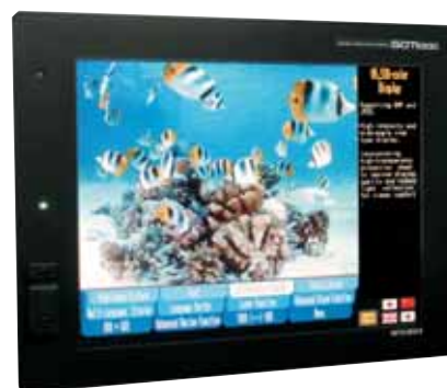
Netteté, taille, couleur : les terminaux graphiques Mitsubishi ne connaissent pas de rivaux dans le monde.