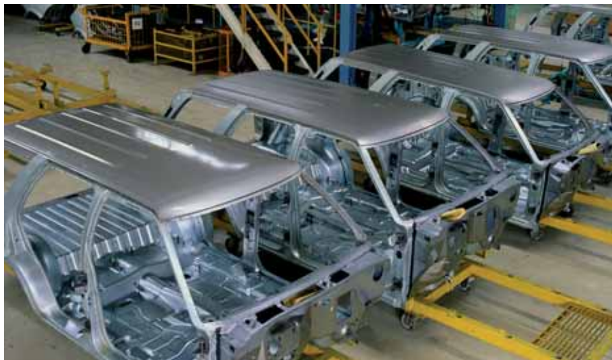
Les systèmes automatiques produisent des marchandises valant des milliards, tous les jours. Quelques centimes suffisent à faire la différence sur les prix unitaires.

La principale raison de cette réussite est la satisfaction des clients. Nous en faisons une question personnelle. Vous le remarquerez à notre première rencontre.