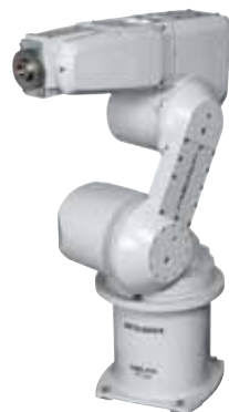
Robots Mitsubishi : précis et durables