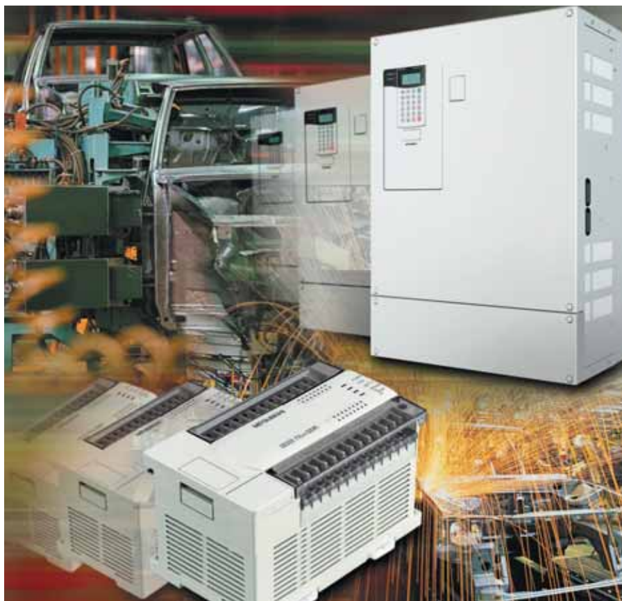
Exemples des nombreuses solutions appliquées dans l'industrie automobile.

Nous sommes présents en Europe depuis plus de 25 ans avec 8 agences Mitsubishi Electric dédiées à l'automatisation industrielle. Un réseau étendu de partenaires fiables n'a cessé de se développer et poursuit sa croissance tous les jours.