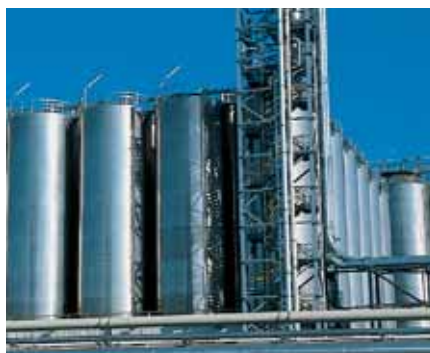
Matériel de grande précision pour la manutention, le mélange et le dosage dans des silos : application parfaite pour Mitsubishi Electric.