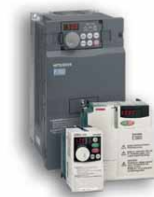
Fiabilité, performances, ergonomie : variateurs de fréquence Mitsubishi

La vitesse et la précision des robots Mitsubishi sont incomparables. Ces appareils sont spécialisés dans la manipulation de micro-charges (avec une précision de positionnement égale à l'épaisseur d'un cheveu) aussi bien que dans la palettisation rapide, le tri ou le montage.