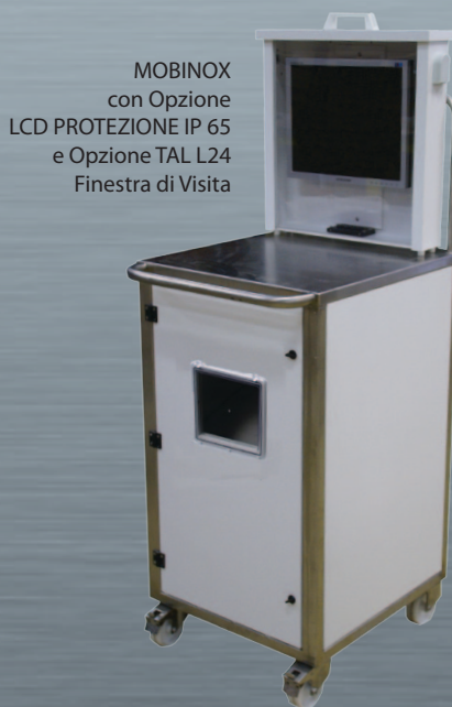
MOBINOX con Opzione LCD PROTEZIONE IP 65 e Opzione TAL L24 Finestra di Visita