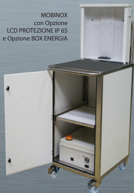
MOBINOX con Opzione LCD PROTEZIONE IP 65 e Opzione BOX ENERGIA