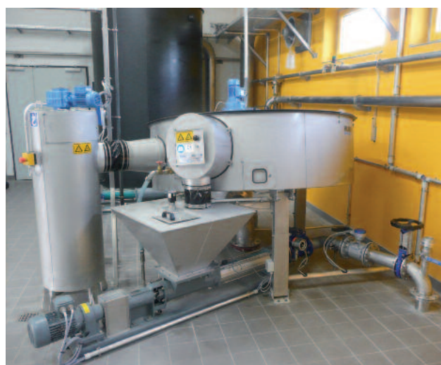
Épaisseur à disque HUBER S-DISC fonctionnant à un débit de 35 m 3 /h