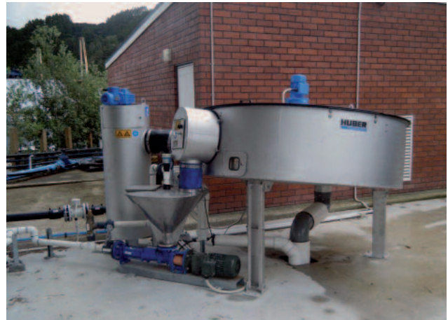
Installation en extérieur d'un épaisseur à disque HUBER S-DISC