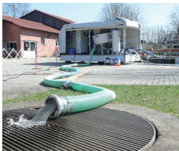
Épaisseur à disque HUBER S-DISC sur remorque; au premier plan, écoulement du filtrat clair