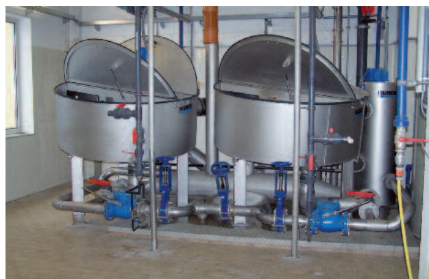
Installation double dans un local d'exploitation exigü