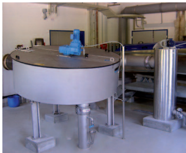
Épaisseur à disque HUBER S-DISC taille 2 avec réacteur de floculation placé en amont