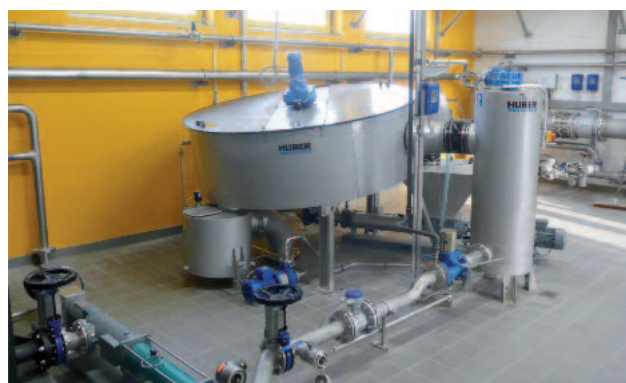
Bac de reprise du filtrat et pompe pour le recyclage de l'eau de lavage